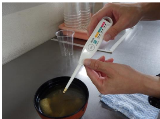
昼食のお味噌汁塩分確認