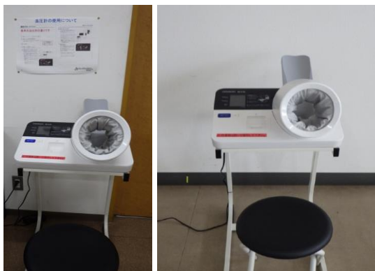
血圧計の設置(玄関・食堂)