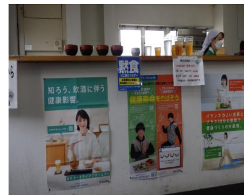
食生活改善活動など